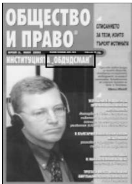
▲ Е това е грешка и то на първа страница!

Въпросът с грешките е следствие от един далеч по-сериозен проблем – грамотността на българчетата. Парадоксално е, че те печелят първите места по френски правопис (нещо действително трудно, като се има предвид че във френския са запазени средновековни форми), а на родния си език допускат елементарни грешки. Което веднага прехвърля топката в полето на образователното министерство – текучество, учителски заплати, реформи, учебници, матури и бог знае още какво. За съжаление в крайна сметка резултатът е слаба грамотност сред завършилите основно/средно образование и все повече неграмотност в страната.