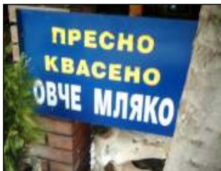
▲ ПрЕсна грешка! От Кресненското ханче

Порочна е типично нашенската практика, като стане гаф, да носим от девет кладенеца вода и да обясняваме защо не е така, какво точно сме искали да кажем и защо този или онзи не ни е разбрал. В повечето случаи добра работа върши трикът с търсената оригиналност.