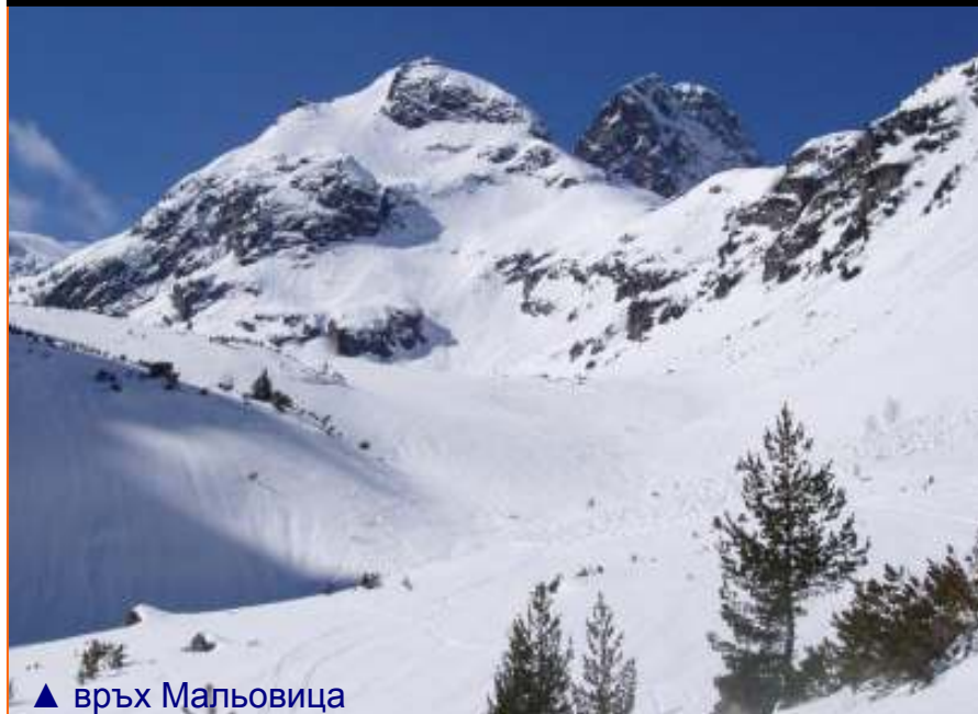
▲ връх Маловица