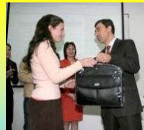
▲ Получаването на лаптопа